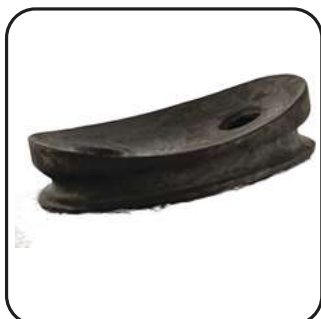
Чаша под ламинацию (ACC-00-162)

FTC-3M-1 L- R Размер 22-31cm Сторона L-Левая R-Правая