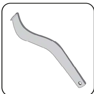
Рожок для снятия оболочки (ACC-00-103)