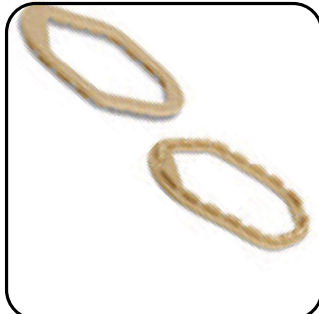
Соединительная пластина (САР-3М-х-L-х)