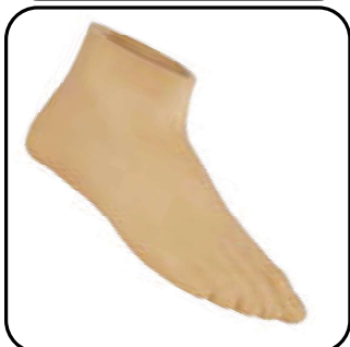
Сменная оболочка стопы высокий профиль (G2) (FTC-2H-xxxL-Rx)

Артикул оболочки стопы (при заказе отдельно)