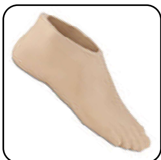
Сменная оболочка стопы Низкий профиль (G3) (FTC-3M-xxxL-Rx)